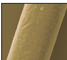
Hårstrå utan någon form av värmeskydd vid hårföning.